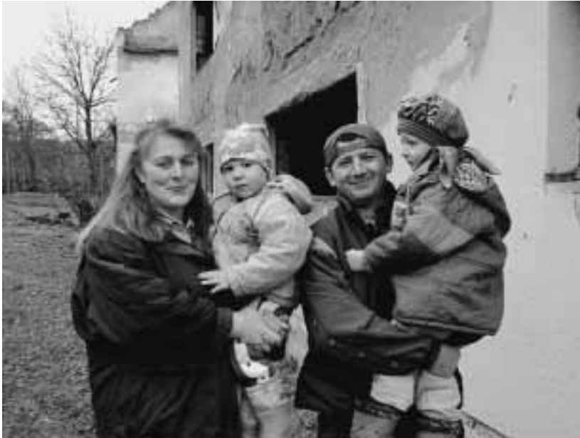
Familie vor ihrem kriegszerstörten Haus in Ivanic Grad, Kroatien