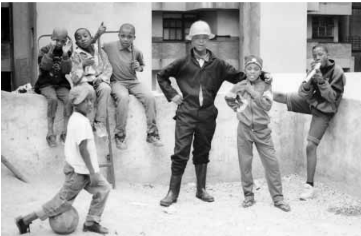
Straßenkinder in Johannesburg, Südafrika

nen. Dieses Kernproblem muss gelöst werden, wenn Armutsbekämpfung und effektive Krisenprävention nennenswerte Erfolge zeitigen sollen. Vor dem Hintergrund der obigen Ausführungen wird deutlich, dass es hier um fundamentale Fragen globaler Strukturpolitik geht.