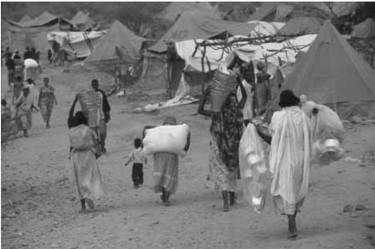
Flüchtlingslager Camp Shelab bei Keren, Eritrea

Für NRO gilt es, sich der Zusammenhänge zwischen Armutsbekämpfung und Krisenprävention stärker bewusst zu werden, daraus folgende Erkenntnisse konsequent in ihre Praxis einzubetten und systematisch weiterzuentwickeln. Es geht darum, Informationsaustausch und gemeinsame Lernprozesse zu organisieren. Diese