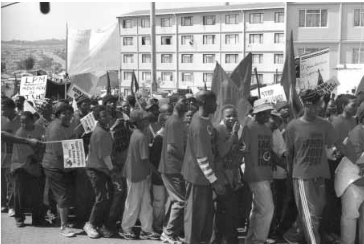
Demonstration anlässlich des Weltgipfels für Nachhaltige Entwicklung, Alexandria bei Johannesburg, Südafrika

mögliche Beitrag der Armutsbekämpfung zur Eindämmung und Transformation von Gewaltkonflikten näher erläutert und der Versuch unternommen, Ansatzpunkte, Instrumente und Akteure zu identifizieren. Ergänzt wird das Papier durch eine Reihe von Empfehlungen, die sich insbesondere an die Bundesregierung richten.